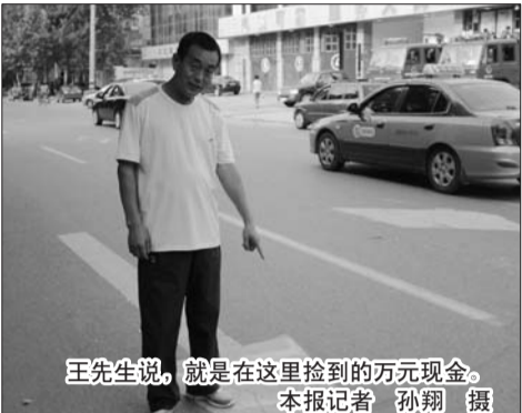
王先生说,就是在这里捡到的万元现金。