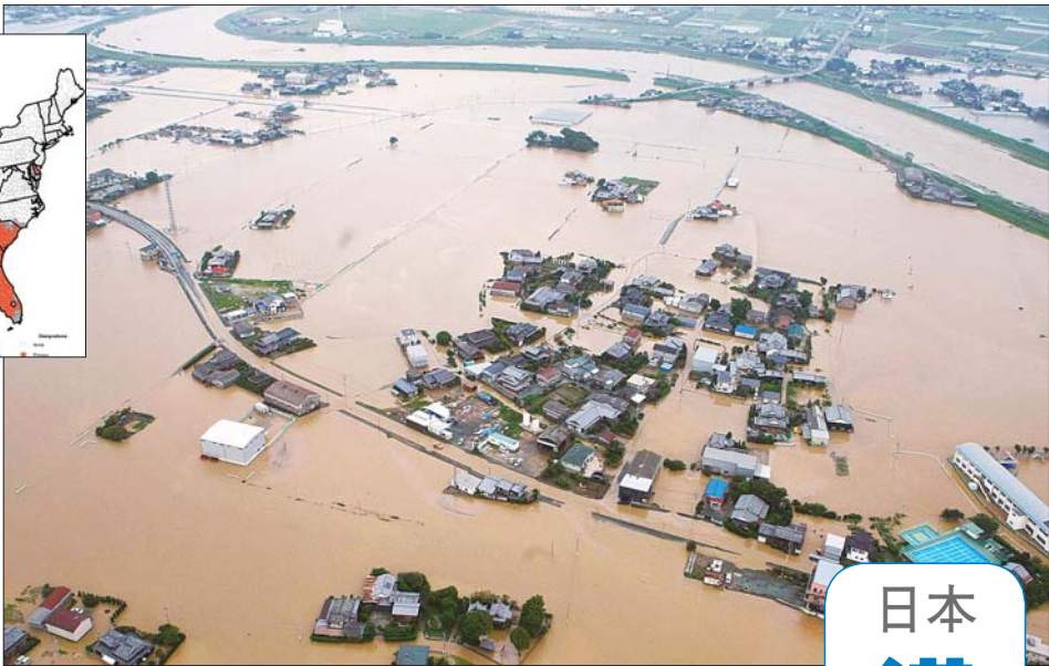
▲这张7月14日航拍的照片显示,日本九州的福冈县柳川市一片汪洋。

由于大豆和玉米目前处于需水量最高的生长期,而此次受灾的许多地区又是大豆和玉米主产区——美国最大的玉米和大豆主产区艾奥瓦州已被列为异常干燥状态——因此今年美国这两种作物的产量可能会大幅减少。 据《中国日报》