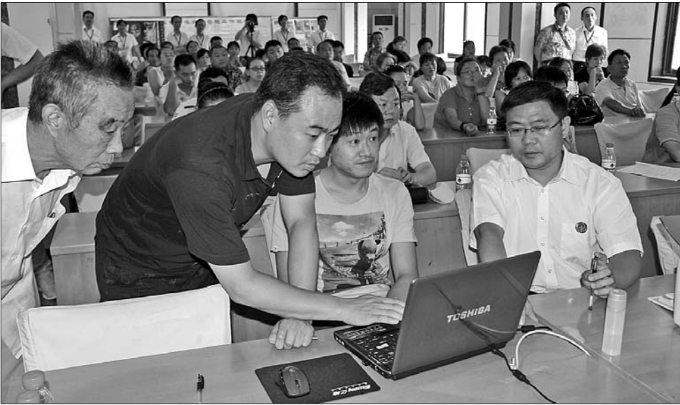
◀申购经适房的市民正在等候摇号。

15时许,摇号仪式准时开始,在主持人简单讲解了注意事项后,摇号系统开始运行,现场不少申购者上前摇号。“太好了!有我的名,最后那个号就是我。”当抽奖活动进行了大半场时,人群中传来了喜悦的欢呼声。坐在记者身后的一名中年女士兴奋地跳了起来。“我得出去给家里人打个电话!”话音未落,这位女士就喜悦地跑出了会场。