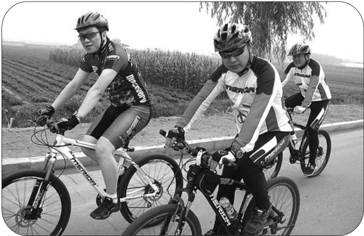
7月1日,日照车友天台山骑行活动。