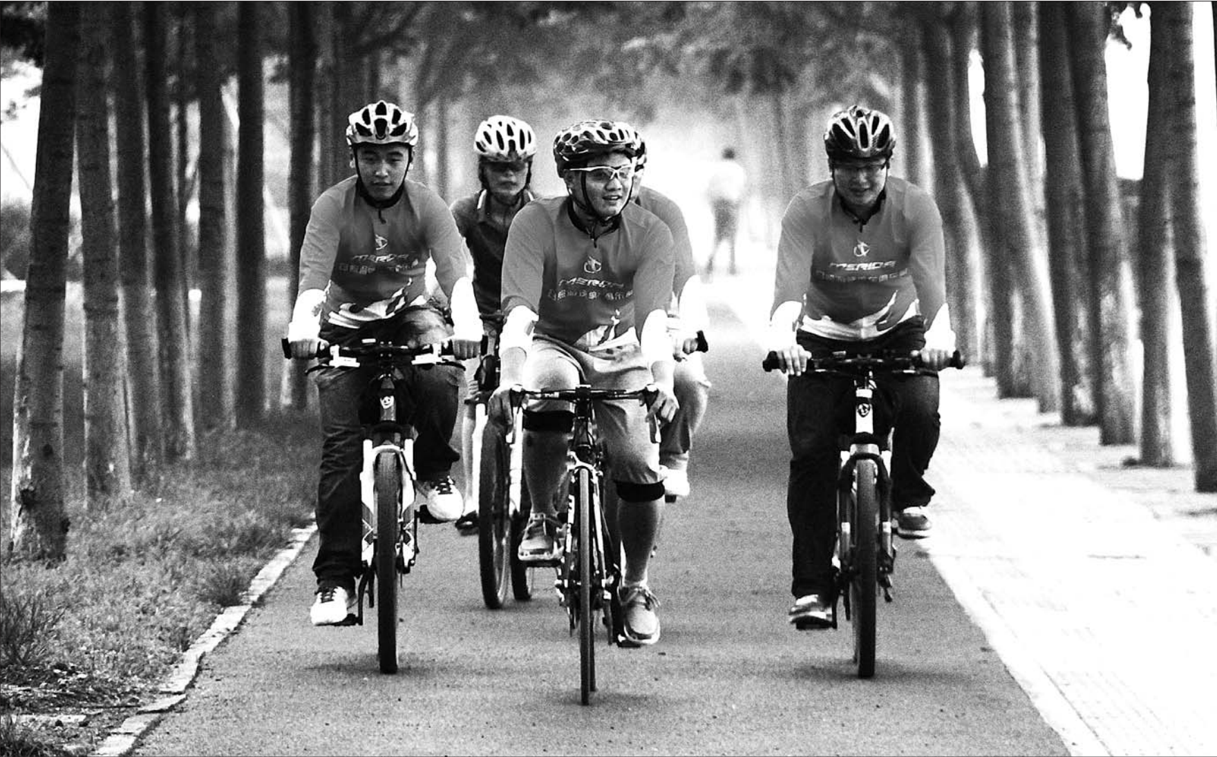
7月9日下午,几位自行车爱好者惬意地骑行在绿道上。