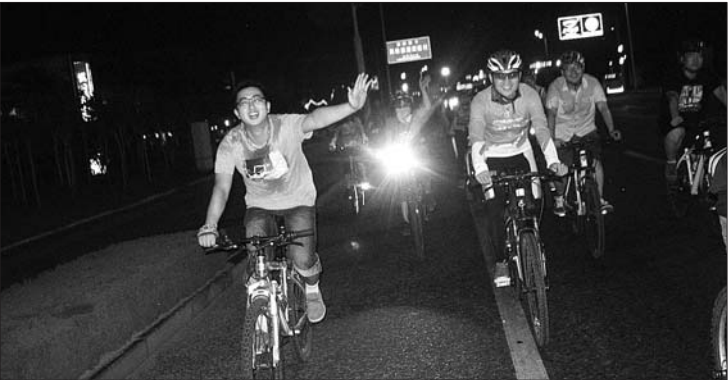
7月4日,游侠单车俱乐部例行夜骑活动。