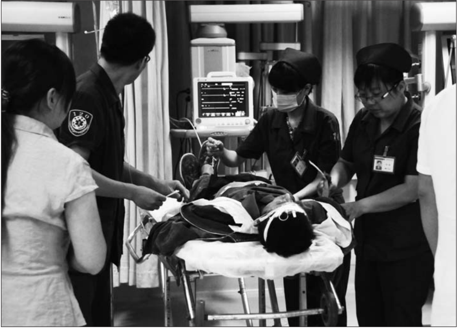
14日夜间,一名车祸伤者被紧急送往滨医附院救治。

急诊处医生贾亭亭告诉记者,夏季周末大家都休息,一些喜欢出来吃点烧烤喝点酒,有时候喝多了就容易打架或是摔伤,还有就是因为吃东西不卫生导致腹泻、呕吐等症状,“一般这两种急症患者比较多。”