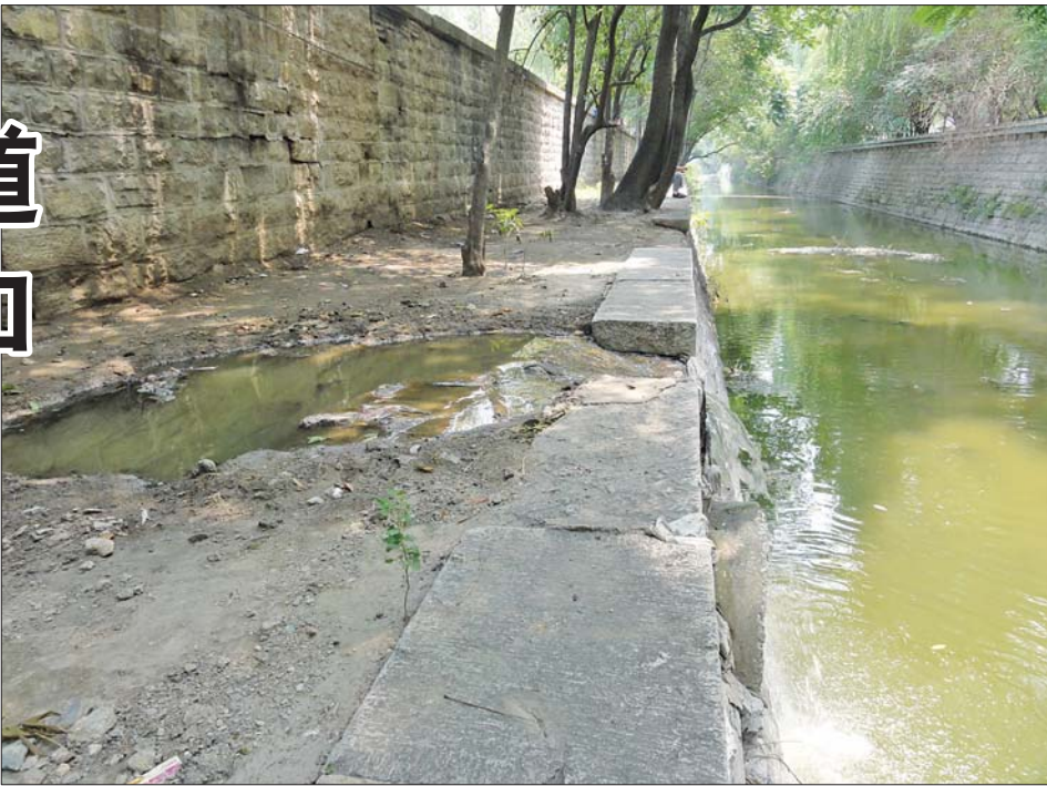
就是这个污水坑,不断地向护城河排污。

“天天都往河里淌,已经有段时间了。”经常在附近钓鱼的张先生对记者说。 记者捡起一根树枝插向水坑中部,发现在水坑中部最深的地方,水深至少50厘米。 水坑下方,一个直径两米多的排污口赫然出现在河堤上,奇怪的是排污口并没有污水排出。 “排污口不排污水,不知从什么时候起有了这个坑,污水就从排污口上面直接排到了河里。”张先生说。 这个坑是怎么来的?该归谁管呢?记者随即与大明湖景区管理处取得了联系。一位王姓工作人员说,这段护城河的确归景区管理。但是,这段河流在护城河截污工程体系之内,