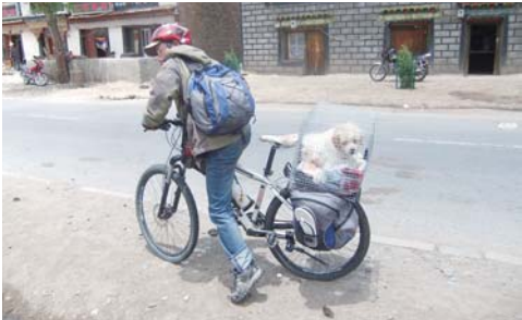
骑行途中遇见励志明星狗小萨。