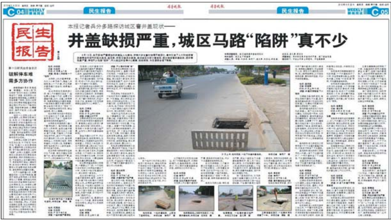
由于窞井盖缺损严重,城区“马路陷阱”不少,本报6月22日民生报告版曾对此重点关注。

资金用于赔偿垫付因井盖缺损给人民群众造成的损失,化解纠纷。待责任明确后,权属部门可依此向责任人追偿。