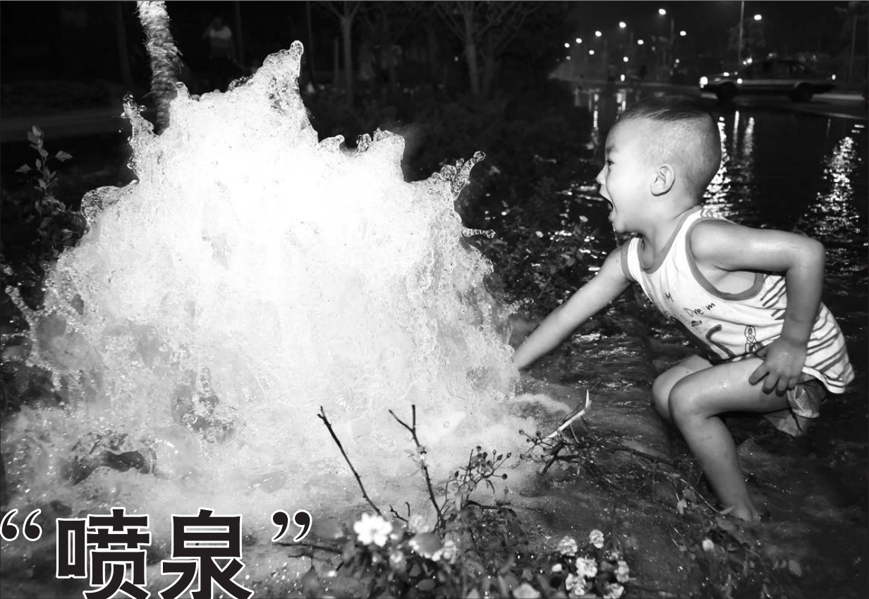
7月16日20时许,菏泽城区太原路黄河路交叉口以北500米处一消防栓断裂引发大漏水,白花花的水像泉水一样喷涌而出,最高时可达半米,很快冲出几百米的水面,引来许多居民围观. 见此情形,记者连忙拨打110报警电话,21时许,菏泽市自来水公司维修人员到达现场,15分钟后,维修人员找到消防栓旁的阀门,终于将水堵上.由于消防栓断裂处十分齐整,自来水公司维修部负责人张长杰推测,消防栓被车撞断的可能性比较大.