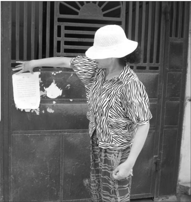
▲小区门口贴的通知。