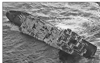
沉没前的“新星”号货轮。(资料片)

“新星”号的香港船主则称在卸货过程中,遭到接收大米的俄罗斯收货方勒索,卸货完毕后对方迟迟不为船只办理离港手