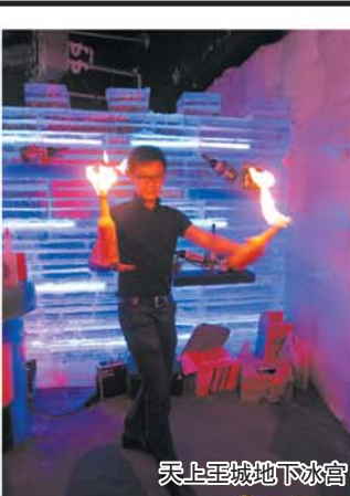
天上王城地下冰宫