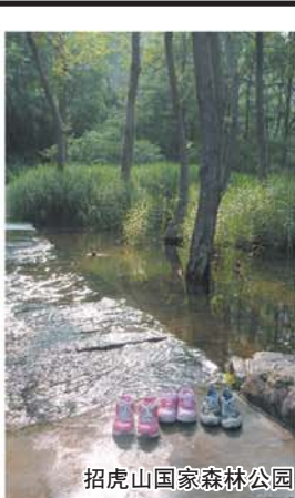
招虎山国家森林公园