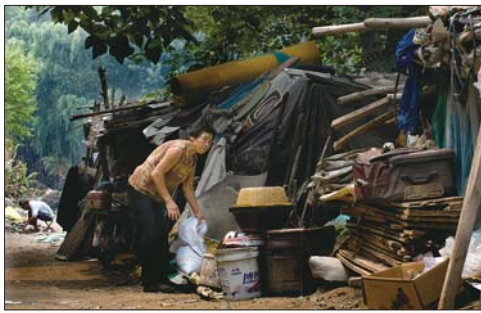
▲他们的大部分家当几乎都是从小清河里打捞上来的。