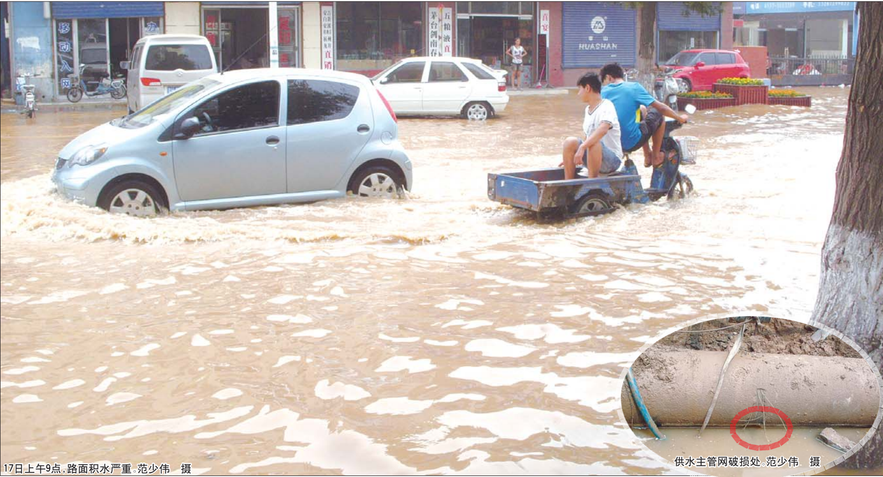
17日上午9点,路面积水严重。