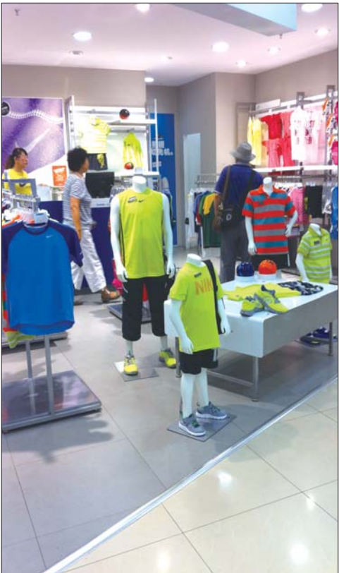
运动品牌的童装大多价格不菲。

本报7月17日讯(记者 秦雪丽) 目前,不少体育运动知名品牌服饰纷纷设立童装专卖店,打造童装运动休闲服饰,受到市民青睐。据业内人士介绍,运动品牌抢滩童装市场,与童装本身利润空间大,国内知名品牌偏少,市场空间大有很大关系。同时,这也是运动品牌战略转移的一种表现。 17日,记者在振华购物中心童装区看到,除了可爱甜美风格的童装之外,童装区“唱”起了运动休闲风。李宁、阿迪达斯等体育运动品牌都开设了童装专卖店,且价格不菲。在专卖店内,尽管商家打出七折、八折的优惠,但一件小短袖售价仍在二三百元,百元以下的服饰很难找到。 据李宁童装店的一位工作人员介绍,李宁在烟台开设童装店已有三四年时间,销量还不错。耐克去年刚在烟台涉足童装业,据店内的工作人员介绍,自开拓童装市场以来,受到不少市民青睐,产品也主要以体育休闲风格为主,“现在的家长认品牌,