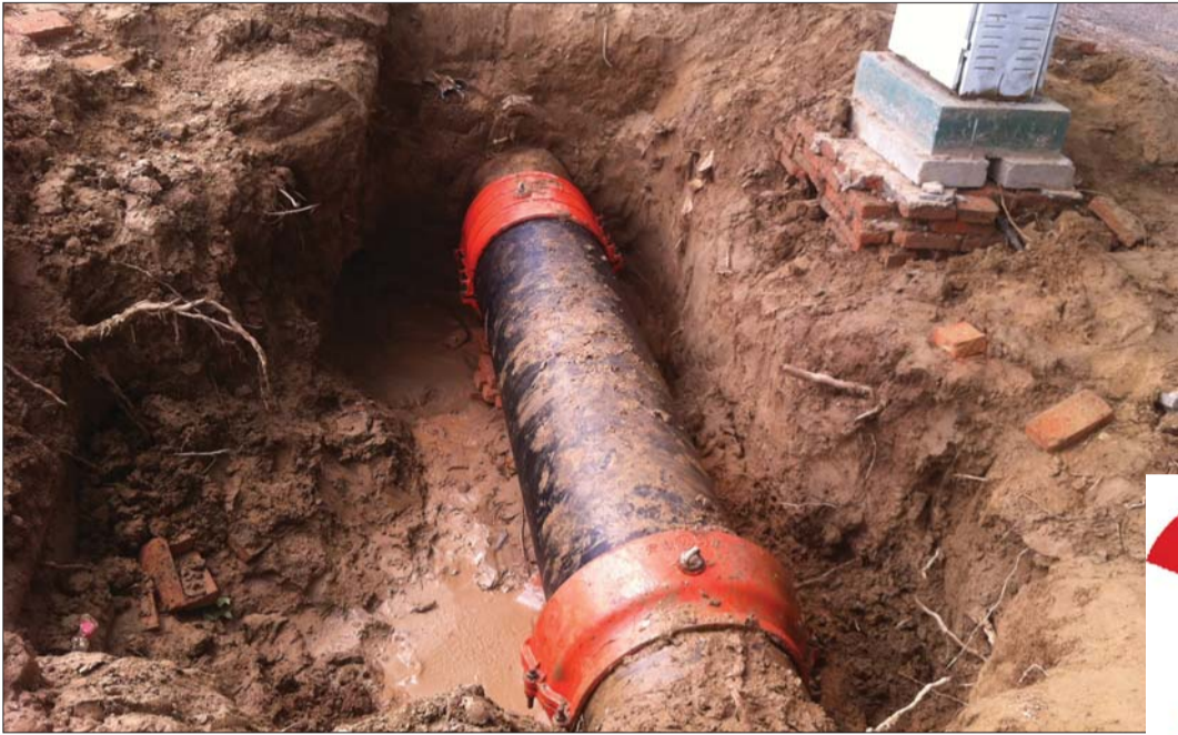
17日,前一天被挖坏的供水管道已更换成新的。

水务集团监察部工作人员介绍,此次野蛮施工大约流失自来水3000多吨,加上维修成本造成的损失差不多有4万多元,这部分钱肯定得由施工单位承担,他们正在和柳园南路拓宽改造指挥部协商此事。除了造成的直接损失之外,从事故发生到抢修结束期间的大面积停水给市民生活和一些单位造成的损失也是巨大的。