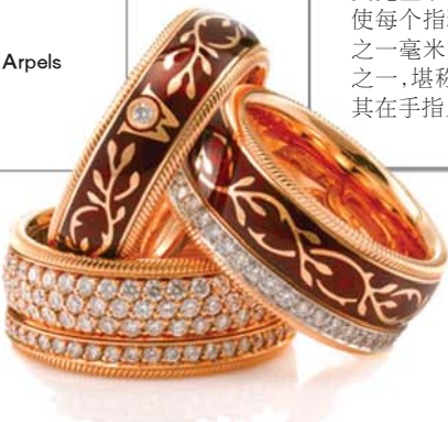
► Wellendorff 2012龙年红色祈愿系列

此次推出的龙年红色祈愿系列选用了华洛芙最经典的旋转指环, 设计反映了克里斯托夫·华洛芙先生于孩子出生时对生命轮回的深切感悟, 为了使每个指环都可以独立转动, 华洛芙的工坊以百分之一毫米的精确度工作, 这相当于头发直径的十分之一, 堪称世界工艺的最高技术。随意转动指环, 任其在手指上飞舞, 助你吉祥如意、心想事成。