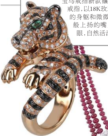
▲BOUCHERON “BAGHA”老虎系列18K玫瑰金镶白钻指环

2012年, 延续BESTIAIRE彩色动物园系列全新创作BAGHA老虎系列; 另外两款为换上新衣PEGASE宝马戒指新款镶嵌金白钻。而TORTUE乌龟戒指, 以18K玫瑰金生动地塑造出乌龟流畅的身躯和微微昂首的姿态, 头部仿佛微笑般上扬的嘴角线条, 搭配祖母绿镶嵌双眼, 自然活泼的神情格外讨人喜欢。