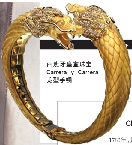
西班牙皇室珠宝 Carrera y Carrera 龙型手镯