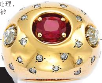
▲尚美巴黎玫瑰金红宝碎钻指环

这款耗时150小时才制作完成的龙型手镯, 采用了逾110克黄金, 龙的头部镶嵌了422颗共计3.78克拉的棕色钻石和4颗白钻, 两只眼睛也各点缀一颗, 共计0.16克拉, 十分奢华。而奢华之外, 手镯整体造型亦十分逼真, 表面以哑光处理, 龙鳞和龙须以及龙首被雕刻得栩栩如生。