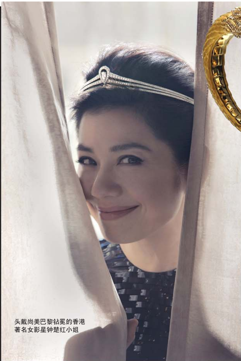
头戴尚美巴黎钻冕的香港著名女影星钟楚红小姐