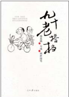
《90老搭档》 诗/池北偶 画/方成