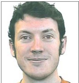
枪击案嫌犯詹姆斯·福尔摩斯

往附近医院。据警方透露，伤者中有几人伤情较重。据报道，受伤者中有一名婴儿和一名6岁儿童。 这是近5年来美国发生的伤亡最严重的一起枪击事件。2007年4月16日，弗吉尼亚理工大学一名华裔学生在校园内开枪行凶，他在打死32人、打伤多人后自杀身亡。