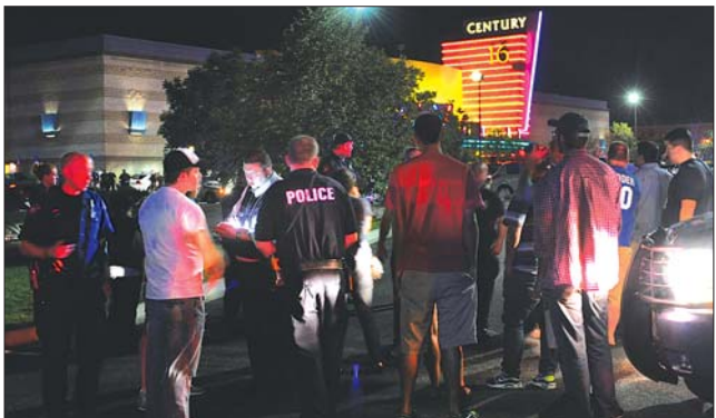
7月20日，警察在发生枪击案的影院外询问目击者。

地上有一个罐子，还在冒着烟。最后我们穿过大厅逃跑。”他说。另一名目击者则称，当时他在看电影，突然听见一系列爆炸声，于是民众纷纷从影院向外逃跑。 还有目击者接受采访时称，一开始她以为是鞭炮声，随后她看见枪林弹雨，子弹直接从一个剧场穿入临近的剧场。她还补充道，袭击者头戴防毒面具。