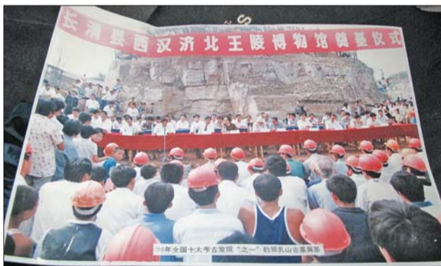
16年前,博物馆奠基仪式现场(翻拍)。

当时,国家文物局下发资金100万元,省文物局下发100多万元。另外,济南市拿出100万元的市长基金,作为地方配套资金,投入博物馆的建设。但没想到,此后,因为建设资金被挪作他用,博物馆建设3个月,累计投入几十万元之后,工程宣布停工了,至今已经16年。