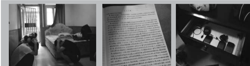
传销窝点现场发现的文字记录和通讯设备。