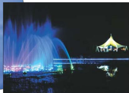
流光溢彩 作者:于敦富 相机:d5510 自述:潍水湿地公园广场是市民休闲娱乐的好地方,时值初夏华灯初上时市民从四面八方来到这里避暑纳凉,喷泉灯光流光溢彩赏心悦目,美丽的夜景扮靓了这个充满魅力的城市。