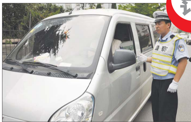
“微循环”开出首张罚单