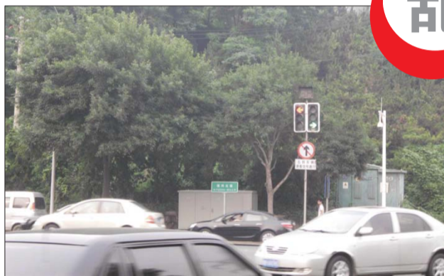
“牛”信号灯 愁坏司机