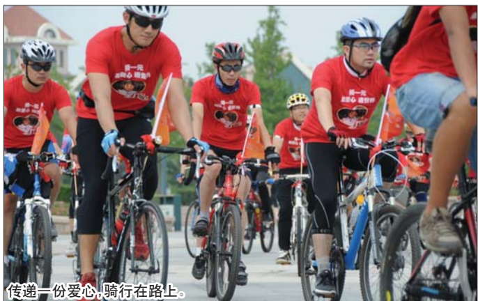
传递一份爱心,骑行在路上。

21日,来自青岛大有乐骑单车户外运动俱乐部的爱心骑手以及青岛社会各界的爱心市民共同组成的“爱心骑行队”聚集在汇泉广场,骑行途径八大关、花石楼、五四广场等,沿途向路人发放爱心书签、零钱袋等,旨在通过这种爱心骑行的方式呼吁更多的市民参与捐款为贫困山区儿童的营养加餐出一份力。