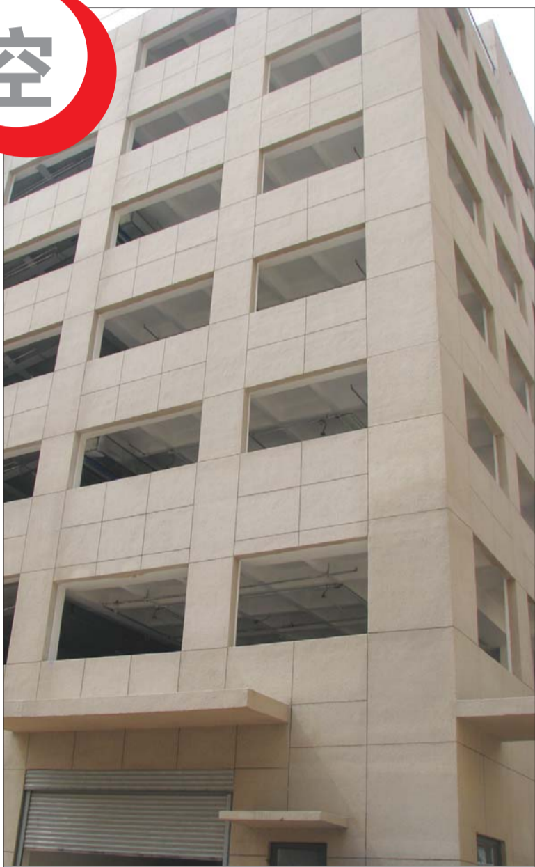
停车楼里 没人停车