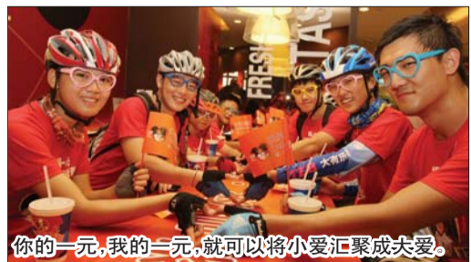
你的一元,我的一元,就可以将小爱汇聚成大爱。

起的2012“捐一元·献爱心·送营养”于7月7日至22日通过百胜旗下遍布全国的餐厅网络全面展开。日前,在“捐一元”项目喜迎5周年之际,项目对外发布了《捐一元项目专项审计报告》以及《捐一元项目营养评估调查报告》,使社会公众了解更多项目细节。过去的四年中,“捐一元”项目共筹集资金超过4000万元,其中百胜集团及员工捐款820万元。累计为四川、云南近60000名学