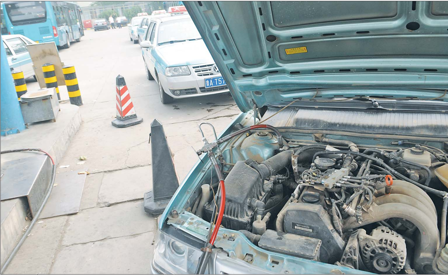
门加,而后备箱内的气瓶总阀门使用相对较少。▲出租车加气时,一般通过发动机舱内的阀

据检测结果,更换新阀门。但考虑到旧阀门已经拆解,新阀门已经安装,重新调换或者检测不但会造成安全隐患,还会给出租车司机带来更多不便。更重要的是,事情起因于检测企业的违规操作,理应由检测企业承担相应损失。