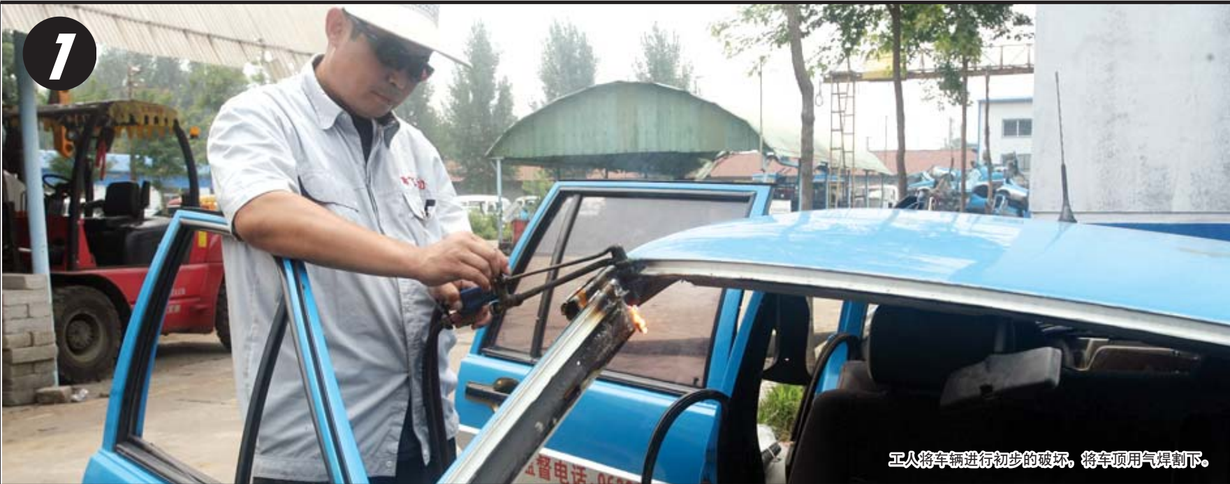
工人将车辆进行初步的破坏，将车顶用气焊割下。