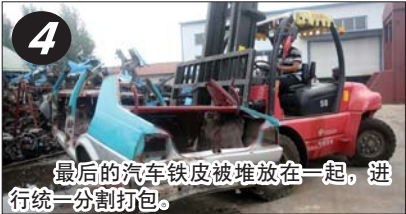
最后的汽车铁皮被堆放在一起，进行统一分割打包。