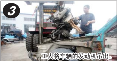
工人将车辆的发动机吊出。