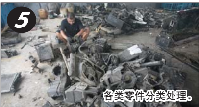
各类零件分类处理。