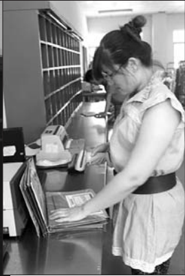
24日当天送出的一份清华大学录取通知书。(大图) 邮政速递工作人员分拣录取通知书。(小图)

本报7月24日讯(首席记者 聂金刚 实习生 李可) 高考提前批的录取通知书已陆续抵达东营,全市已发放近500封高考录取通知书,仅东西城就300多封。24日开始,清华大学等名校的高考录取通知书开始抵达,当天两封清华“喜报”送到了考生手中。 记者在高考录取通知书分发点看到,东营邮政速递的工作人员正在分拣下午抵达的录取