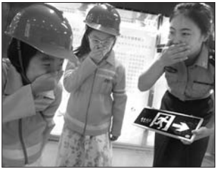
孩子们穿上消防服装体验消防。

的中队长的引导下,开着“消防车”拉着警笛前往着灭火现场……在紧张热烈的气氛中,既树立了孩子们的消防安全责任感,也让小“消防员”们了解到更多防火灭火的常识。既满足了他们对“消防”的好奇心,也提高了灭火逃生的技能。 据了解,东营区消防大队每天会派出一名消防宣传人员在“小型消防队”里,在保障“小消防员”安全的基础上,为他们讲解防火灭火的相关常识。