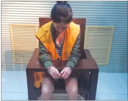
女酒托张某某在派出所接受审讯。

席间,女酒托经常一杯接一杯地给顾客倒酒,有时还会与顾客做游戏,加快他们的喝酒速度。等顾客微醉时,再接连买酒,尽可能让顾客消费。