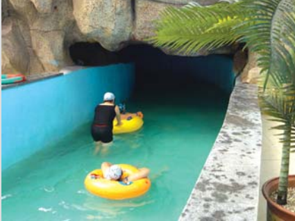
漂流河内没开照明灯。