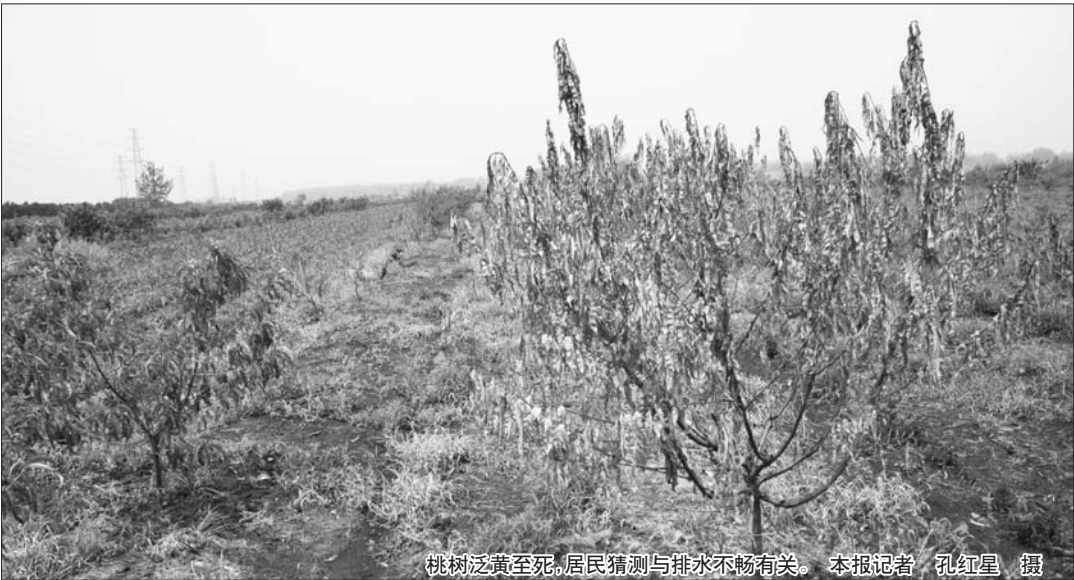
桃树泛黄至死,居民猜测与排水不畅有关。

本报枣庄7月24日讯(记者 孔红星) 滕州市北辛街道一片农田附近,由于绿化时填埋了排水沟,又加上连续的降雨,农田的积水无法排出。导致附近百余棵桃树死亡。目前,该村村委正在与相关单位协调,尽快疏通排水沟。 24日,家住滕州市北辛街道小岗村的李先生望着田里的果树,既伤心又无奈。接连几场大雨,他田里的积水无法正常排出,使得50多