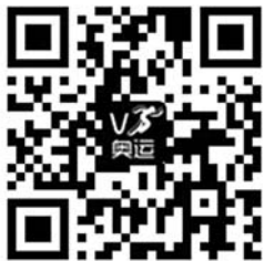
示范二维码。(李娜伦敦传递火炬实况)

随着智能手机的普及以及3G、WIFI网络环境的成熟,一种连接报纸、手机和网络的新兴数字媒介二维码,即将改变读者的奥运阅读习惯。“VS码”是本报联合“VS奥运”针对本报读者独家定制的包含伦敦奥运比赛图文、视频信息的二维码,使用智能手机下载“VS奥运”等二维码扫码应用工具,并对印制在平面载体上的“VS码”进行“拍照”,便可以轻松地阅读观看奥运会的相关图文、视频。