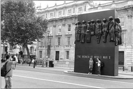
▲游人在“二战中的女人”雕塑下拍照留念。

白厅街的雕塑一直在讲述战争,但并不像其他地方的一些雕塑那样强悍夸张。那些被纪念的英雄们,手上几乎没有任何武器,有的只是各种各样的鲜活表情。 这也许是一种隐喻。英国人纪念战争,是彰显英雄们的决心与信念,而非故意渲染暴力与杀戮。这让战争的意义变得更加多元,在不同人群的心里,留下属于自己的投影。 在白厅街中段,有一座比较新的雕塑,在众多英雄好汉的包围之下,显得别具一格。这座雕塑的名字为“二战中的女人”,并无一个具体的人像,更多地是在展示一种情感。远远望去,仿佛是一个“衣架”,挂着各种各样的衣饰。有长裙,还有挎包,但间或地夹杂上了几件戎装,让人警醒。 离这座黑褐色的雕像不远,便是著名的“和平纪念碑”。在现场我们看到,每一位经过纪念碑的英国士兵,都会恭敬地注目而视,行着军礼踢着正步走过。 奥运会在即,世界仍然不太平。为了保卫奥运会的安全,英国从阿富汗驻军中调来了大批战士,参与到安保工作中。军人与反战者对面而立,各行其是。 远离争执与战争,留下微笑与和平,奥运会本该如此。但目前,尚不知何时,刀枪入库战士解甲。 (伦敦7月26日电)