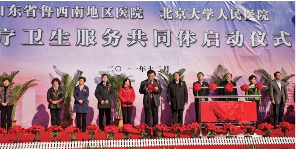
北京大学人民医院鲁西南基层医院医疗卫生服务共同体启动仪式

金乡县人民医院作为鲁西南地区首家二级甲等医院，担负着全县及周边地区近200万人民群众的健康及保健使命。医院始建于1949年，2002年成为济宁医学院附属医院，现已发展为一所技术精良、设备先进、功能齐全，集医疗、教学、科研、急救、社区服务为一体，具有三级医院规模、技术、管理和服务水平的综合性医院，在鲁西南二级医院中处领先地位。