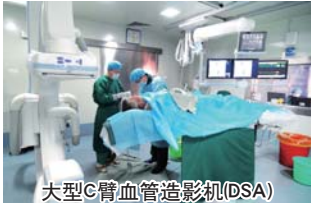
“上通下达” 让国家级技术服务金乡人民

金乡县人民医院 建筑面积9.4万m 2 ，固定资产3亿元，年门诊量65万余人次，年收治住院病人5万余人次，居全省县级医院前列。现有在职职工967人，其中高级专业技术人员155名，中级专业技术人员226名。设有临床、医技、职能等60余个科室。现编制床位900张，实际开放床位1200张；拥有鲁西南地区首台国际先进水平的德国原装进口高档、多功能西门子64排螺旋CT，鲁西南首台德国西门子原装大型C臂血管造影机(DSA)，美国GE1.5T光纤磁共振，西门子双光子直线加速器及X-刀等大型医疗仪器400台(件)。医院近年来把坚持公益性、追求社会效益、维护群众利益和构建和谐医患关系放在第一位；针对群众看病难、看病贵的问题，紧紧抓住“提高服务质量、控制医疗费用”的关键，从满足人民群众的医疗需求及医院发展的角度出发，实施了从管理、服务到技术、发展的全面创新，坚持多措并举，真正解决群众看病难、看病贵问题。