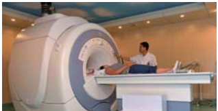
鲁西南首台美国GE1.5T光纤磁共振

近年来，医院在保持全国卫生系统先进集体、省级文明单位的同时，又先后荣获全国“五四红旗团委”、全国百姓放心示范医院、全国模范职工之家、全国诚信示范医院、全国改革创新医院、山东省先进基层党组织、山东省服务名牌(山东省县级医院唯一)、山东省惠民医疗先进单位等称号。医院因管理科学、业绩显著，被卫生部命名为经济与政策研究重点实验室研究基地，被省卫生厅誉为“山东省县级医院的管理模式”在全国卫生系统产生较高影响，北京、天津、江苏、安徽、河南、河北、湖北、广西、黑龙江、辽宁、山西、江西及省内外慕名前来参观学习的二、三级医院达500余家。金乡县人民医院现已成为一所享誉山东省、辐射苏豫皖，服务覆盖周边人口达200万的鲁西南地区知名医院。