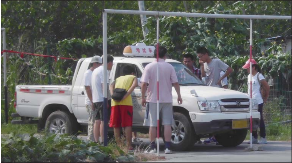
人多车少,烈日下,学员们要排队学车。