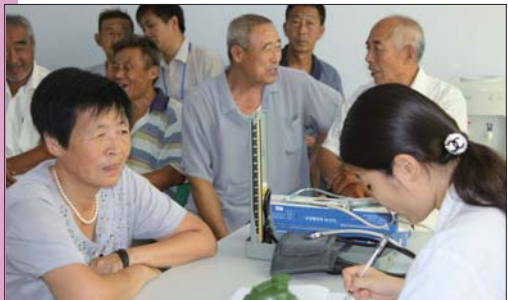
2011年6月28日，平原县与山东省中医院联合启动“教师健康支撑计划”。图为山东省中医院专家为教师查体。