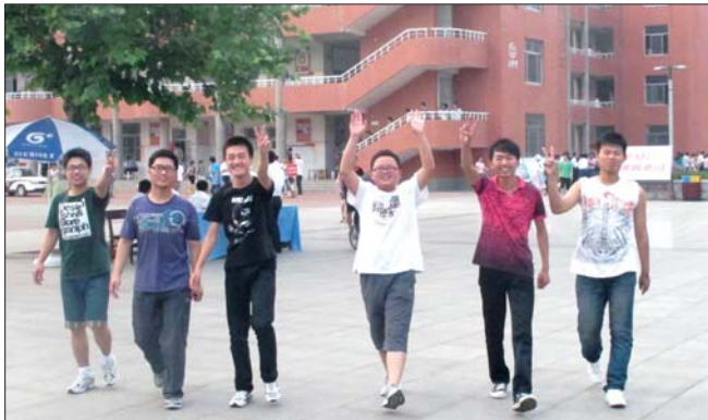
考生们轻松自信地走出考场。

全县建立了学校安全联席会议制度，制定了学校安全工作预案，坚持常年开展校园安全竞赛，定期组织学校食品安全培训，及时整改安