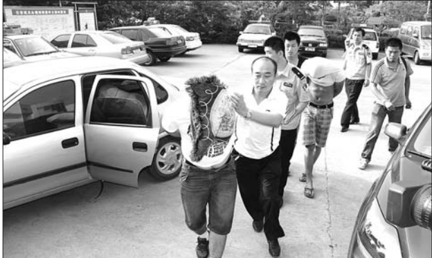
民警将嫌疑人押回日照。

两名临沂沂南籍男子自3月份以来,流窜临沂各区县及日照莒县盗窃电动车电瓶。未想到在莒县作案时因忘了换假车牌被监控拍到,被警方循踪逮住。