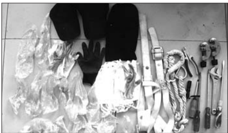
查获的撬棍、头套等工具。

本报7月26日讯(记者 徐艳) 三个贵州籍男子万万没想到,行李里装着齐全的撬盗工具刚到日照的宾馆入住3个小时,就被来宾馆例行检查的民警识破并抓获。