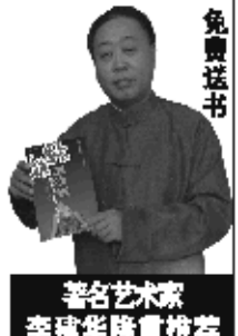
著名艺术家 杨海君隆重推荐

日前,为配合国家疾控中心公益事业,国家男性生殖健康指导中心向全国免费赠送《拯救男人生命腺》一书,帮助前列腺患者解除痛苦。如果您正饱受前列腺疾病及并发症的困扰,可拨打电话400-005-2353免费领取此书。