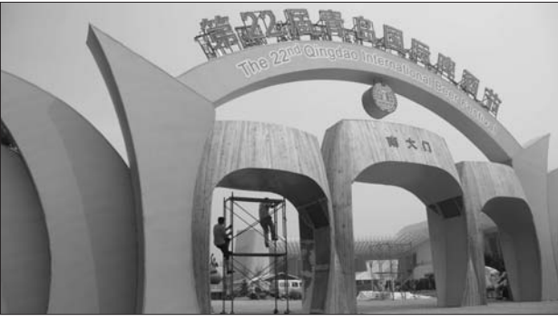
今年啤酒城南北两侧城门将以拱门风帆造型迎纳海内外游客。

本报7月29日讯(通讯员 袁绍明 隋冲 刘超 记者 邱晓宇) 第22届啤酒节移师世纪广场