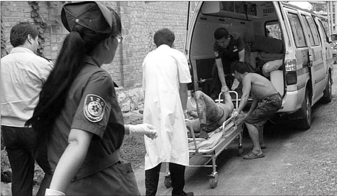
29日下午3时10分,在张店区铁五村一50多岁男子从四楼跳下,被紧急送往医院检查,确认男子几乎全身赤裸,摔下后仰面躺在地上,身上沾上了很多泥土,身体有大面积擦伤。据了解,该男子系与老伴吵架后,一时冲动跳了楼。 (奖励热心读者话费100元)

本报7月29日讯(记者 孙慧瑶 通讯员 王东 曹蕊) 一女子以新加坡LV公司为幌子进行传销诈骗。参与群众达35人,涉案金额69.4万元。近日,博山警方在“破案会战”中将犯罪嫌疑人抓捕归案。 据了解,博山区博山镇刘某以向新加坡LV公司投资“私募股权”盈利活动为幌子,多次到社区、农村宣传所谓的盈利投资,并承诺高利息回报和发展下线获取业务奖励。刘某自己投资7万元同时发展下线人员,下线人员越多刘某获得提成就越高。 在此传销活动中,参与传销人员大多是退休工人和村民,投入资金多的10万元少则700元,均是轻信对方所谓“低风险、高回报”的虚假宣传所迷惑。