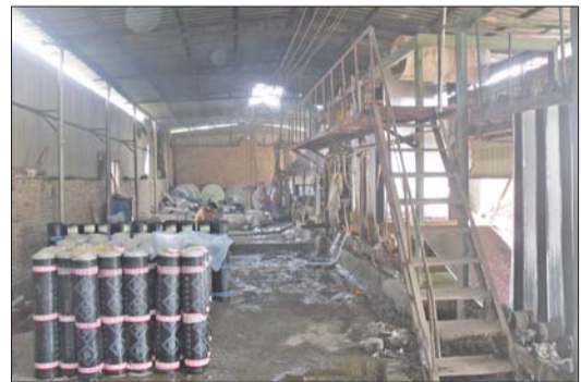
黑窝点厂内堆放着刚刚生产的劣质油毡。