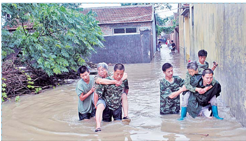
消防官兵正在转移被困群众。

省气象台于8月1日16时30分解除暴雨黄色预警信号。不过,暴雨黄色预警信号暂时解除并不意味着本轮降水结束,2日夜间开始,降水东移,鲁东南、半岛和鲁中地区有中到大雨局部暴雨,并伴有雷电。