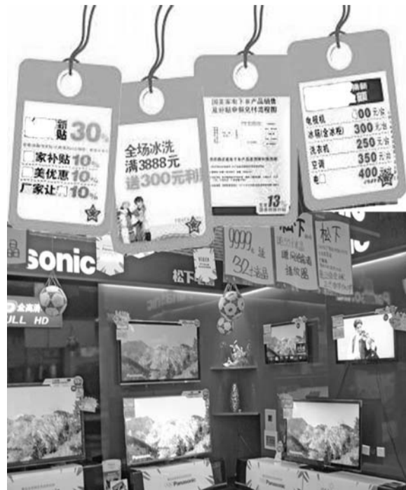
泉城路一家电卖场顾客稀少,只有电视样机屏幕在闪烁。