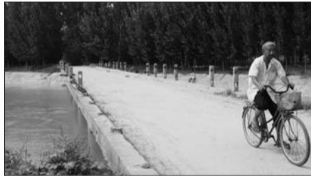
韩墩引黄干渠生产桥两侧的护栏已经破败不堪。

此外,桥东面通往西刘村的路上还有一条10米左右的沟,但是两边没有护栏,写着警告的石柱也被杂草遮住。“不知道的人会认为是条普通村路,很容易就摔下去。去年还有人从这里直接就冲下去摔着脖子了。”村民刘先生称。