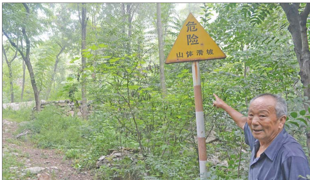
在山脚下,竖着“山体滑坡 危险”的警示牌。