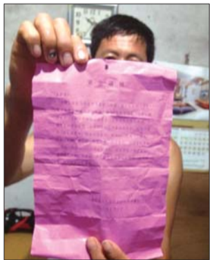
养殖户都收到了街道办事处发的紧急通知。

沿海养殖户由占友家的大铁门外就是海,阻隔在他家与海之间的只有一道1米6左右的防潮坝。因风势强劲,由占友家的大铁门用木桩顶起来,预防大风吹散铁门。对于在海边久居的养殖户们来说,风暴潮已经常见,他们会加固堤坝水平面矮的地方,注意门窗的闭合是否牢固。庄上村及附件的居民生活秩序井然,未有太大改变。