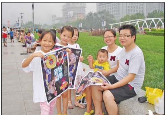
小报童在泉城广场卖报纸。

本报讯(记者 刘伟实习生 陈帅) 祖国健儿在奥运赛场摘金夺银之际,齐鲁晚报的奥运小报童队伍也在不断壮大。8月4日,有9名来自山师附小一年级三班的雏鹰小队队员又加入到报童队伍中来。小报童们下午两点领到了号外,不到两个小时,一百多份号外全部卖出。