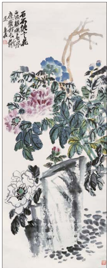
吴昌硕《五色牡丹图》

此外,超过百年历史的古字画尽量不要长期挂在家里。每年在秋日里悬挂三日,通风晾凉即可。经过实验,一张纸本绘画悬挂在墙上的寿命大约有20年,此后,就要靠不断地进行修补使之“苟延残喘”。而对于家中悬挂的新画也有讲究,每年以张挂一个月为宜,室内照明用无红、无紫的灯光为佳。王嘉