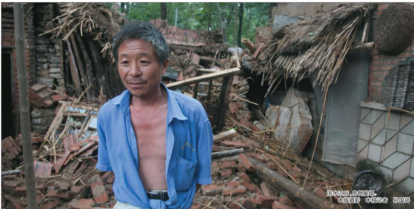
洪水过后,房倒屋塌。

4日,青州王坟镇文里村村前的文里桥已经有一半垮塌,而桥原有的四个桥墩,被山洪冲毁了俩,只剩2个,目前桥已经被禁用。抢修便道的青州交通局养护公司经理董克昌告诉记者,当日早上6点就开始设置安全警示标示拉警戒线,确定便道位置,一大早就调入两台挖掘机抢修道路,已经忙碌了一上午,晚间道路能通行。