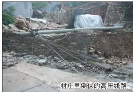
村庄里倒伏的高压线路。