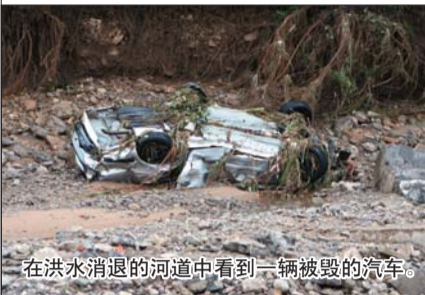
在洪水消退的河道中看到一辆被毁的汽车。

体和河道、水库情况,避免发生山体滑坡等次生灾害;卫生部门正积极做好灾后防疫工作;农业部门指导农民采取有效措施,恢复农业生产。同时,对死亡人员家属进行妥善安排,相关人员情绪稳定。 本报记者 秦国玲