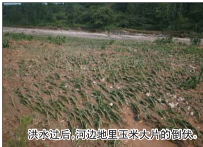
洪水过后,河边地里玉米大片的倒伏。