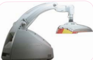
欧美娜红蓝光治疗仪。

地址:迎暄大街216号(电视台东邻)门诊楼二楼皮肤科门诊 咨询电话:0538-6117171