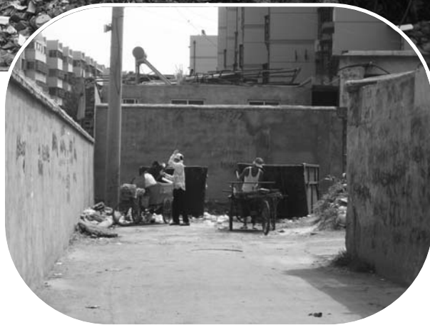
▶清洁工把垃圾倒入空的垃圾箱中。