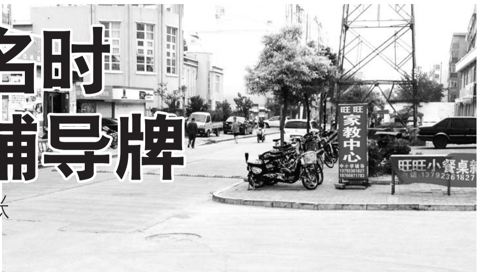
一小学门外,小餐桌摆出招生横幅。

本报济宁8月6日讯(记者 汪洸) 3日-5日,济宁城区各小学接受入学报名,而小餐桌也开始在小学门口打起了广告,趁机招揽生意。记者调查发现,今年不少小餐桌开始打起了辅导牌,孩子中午吃饭的时候,还能由老师辅导孩子写作业,受到了不少家长的青睐。