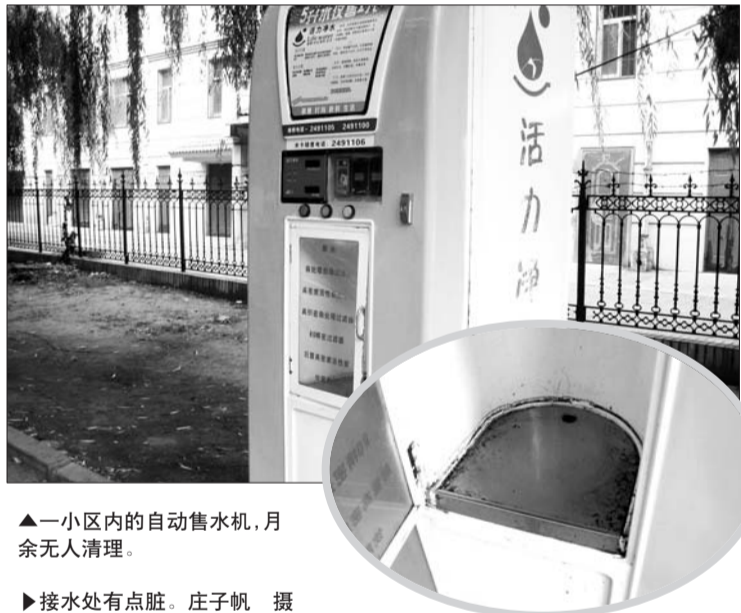
▲一小区内的自动售水机,月余无人清理。

随后,记者拨通了自动售水机上留下的联系电话,“我们公司会定期派专人进行打扫,可能是最近负责打扫这个小区的工作人员太忙忘记了。”瀚塘活力水有限公司的一位工作人员表示,将立即通知相