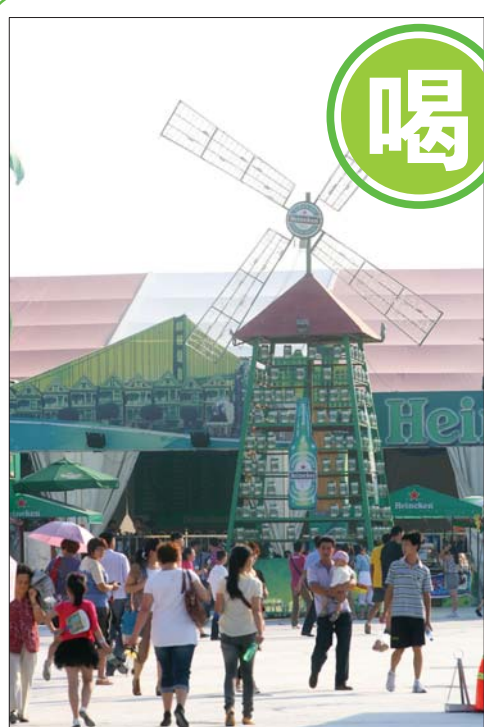
荷兰喜力啤酒馆很有异域情调。(资料片)

和太平洋北部的的新鲜多春鱼,烹饪时,经过唐扬粉炸制后,多春鱼会变得外焦里嫩,鲜美可口。此外,经过酱料腌制、蛋液包裹、入锅油炸的黄金鱿鱼圈也将挑战游客的味蕾,让游客尽享美食的乐趣。