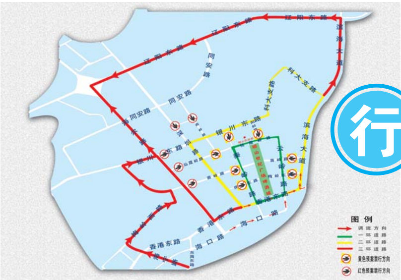
啤酒节交通拥堵示意图。

此外,自8月1日至30日,崂山区苗岭路(云岭路至秦岭路段)、梅岭路(云岭路至秦岭路段)实行临时封闭。世纪广场啤酒城设东、西、南、北四个进口,只允许行人通行。其中,东